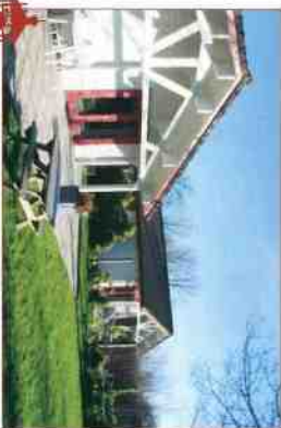
Vakantiehuisen "Thuredrith" (links) en "Crayestein" (rechts)

In de periode van November tot April zijn de huizen beschikbaar voor M.S.-patienten.