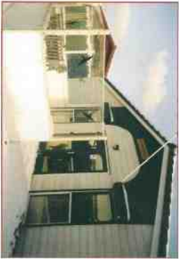
Vakantiehuis "Mi Mekore"

Als er dan een moment komt dat het patiëntje (voor even) naar huis mag breekt er weer een drukke periode aan: veel bezoek van buren, vrienden, familie, vrienden en vriendinnenjes. Dit medeleven is zeer belangrijk en goed bedoeld. Toch heeft het gezin dan ook rust nodig.